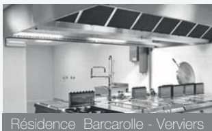
Résidence Barcarolle - Verviers

SPÉCIALISTE VENTILATION +32(0) 4 263 36 96