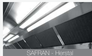
SAFRAN - Herstal

Cet institut accueille en moyenne 1500 élèves, il est équipé d'un plafond filtrant sur mesure avec un éclairage led spécifique.