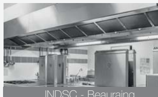
INDSC - Beauraing

En bord de Meuse, cet établissement est équipé d'une ventilation double flux avec une réinjection d'air.