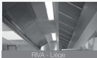
RIVA - Liège

Cuisine équipée d'une ventilation à compensation triple flux avec batterie de chauffe et local de laverie ventilé.